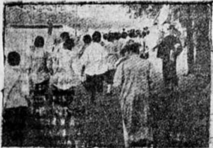
Демонстрация китайских студентов.

Это указывает, что рабочие Китая стойко борются за свое освобождение и эту борьбу доведут до конца. Английская буржуазия сильно обеспокоена упрямством китай-