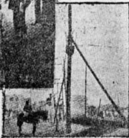
Японский дозор следит за демонстрацией.

дителей забастовки, пригрозить рабочим тюрьмой и расстрелами, а для показа расстрелять вождя рабочего движения и заставить китайских рабочих прекратить забастовку. Но империалисты ошиблись в своих расчетах. Как только Чжан-Зо-Лин закрыл и опечатал комитеты нескольких профсоюзов, как только вожди союзов моряков были арестованы, раздался новый боевой клич по рабочим рядам. Тысячи моряков со своими знаменами прошли по улицам Шанхая, подошли к штабу войск Чжан-Зо-Лина, требуя освобождения арестованных, толпы демонстрантов рабочих присоединились к морякам и весь Шанхай опять загудел протестом против иностранных экспло-